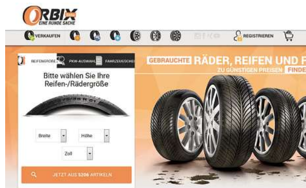
Auf orbix.de können auch Händler gebrauchte Räder und Reifen anbieten.